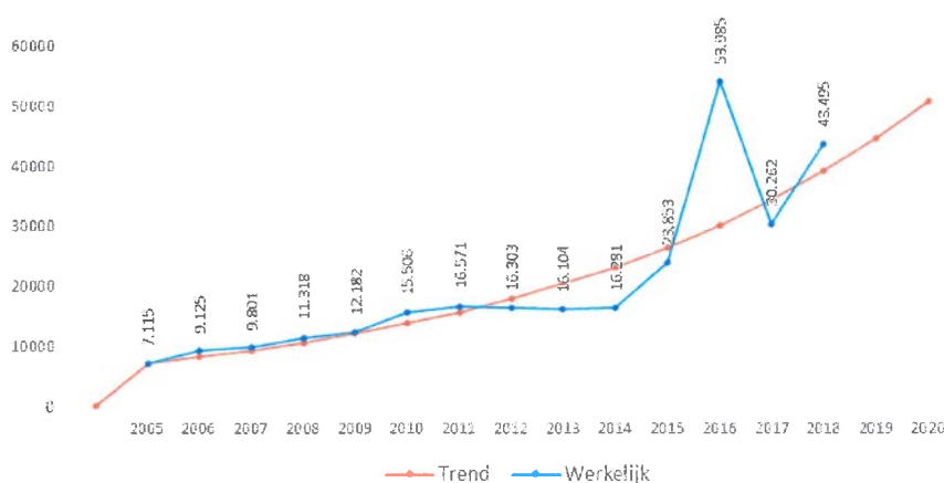
Aantal bezoekers Museum Het Schip 2005 - 2018

jaarlijkse stijging van het bezoekersaantal en ligt het museum weer op de gewenste koers. De verwachting is dat door een grotere marketinginspanning en het organiseren van tijdelijke tentoonstellingen, het aantal bezoekers nog zal stijgen in de komende jaren naar een aantal van 50.000.